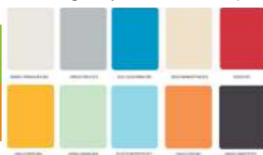
Tabella colori per struttura e sportelli (Per ordini consistenti possono essere eseguite personalizzazioni)