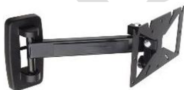
pieghevole porta LCD da 10" a 30"

E' possibile utilizzare dei sistemi per messaggi pubblicitari quali monitor o cartelloni grazie ai seguenti accessori da installare sul tetto del sistema.