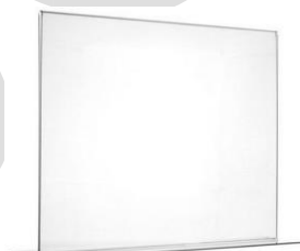
Espositore verticale formato A3 orizzontale